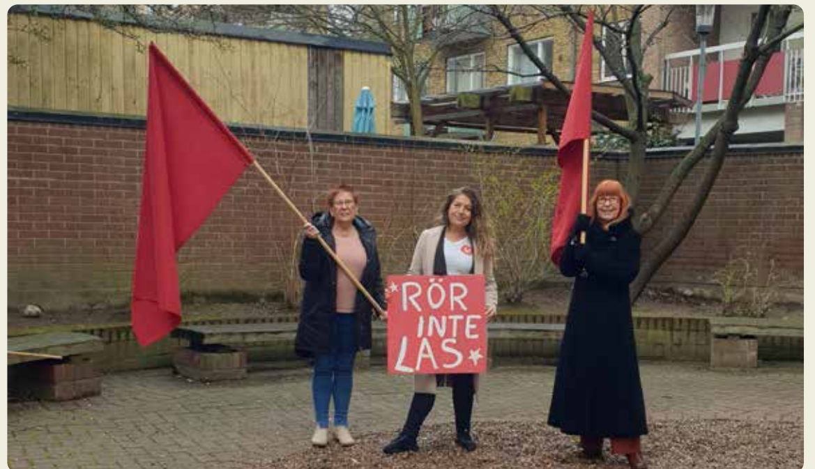
För starkare arbetskydd! Vi vill ha bättre villkor för anställda. Högern har tagit segrar som vi måste ta tillbaka.

Vänsterpartiet ställer inte upp på försämringarna av LAS. Vi måste vara med och påverka fackföreningsrörelsen. Det gäller att vi organiserar oss bättre och påverkar våra fackföreningar. Vi får aldrig ge upp våra fackliga rättigheter!